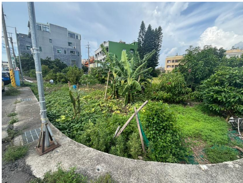
勘估標的使用現況