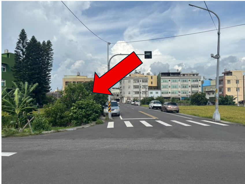
勘估標的臨路現況-仁親路