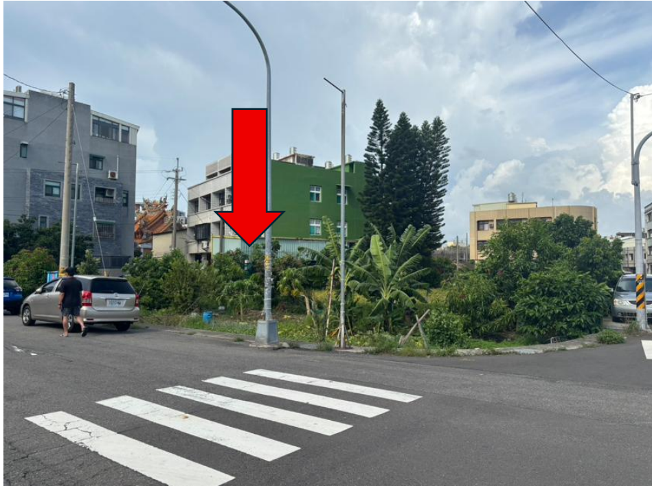
勘估標的土地外觀