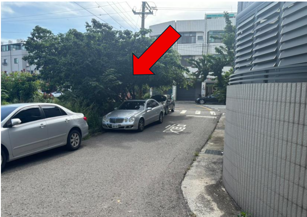
勘估標的臨路-七寮路