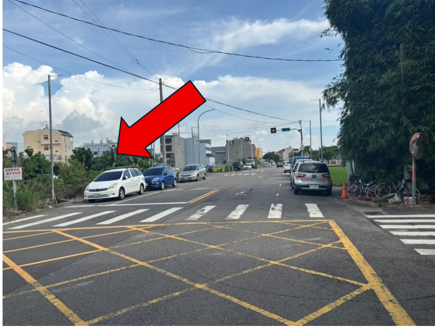
勘估標的臨路現況-愛華路