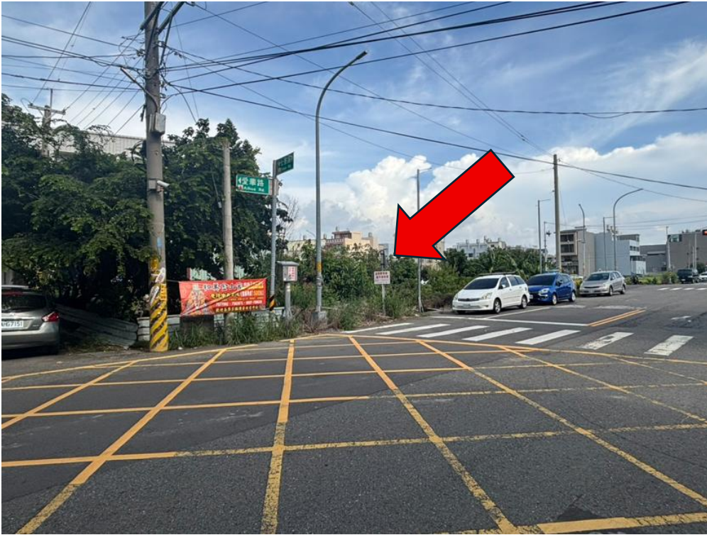
勘估標的土地外觀